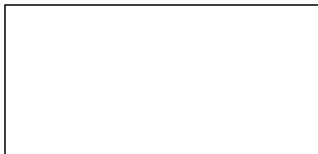
Рисунок 1 - Общий вид средства измерений

Схема пломбировки от несанкционированного доступа, обозначение места нанесения знака поверки представлены на рисунке 2.